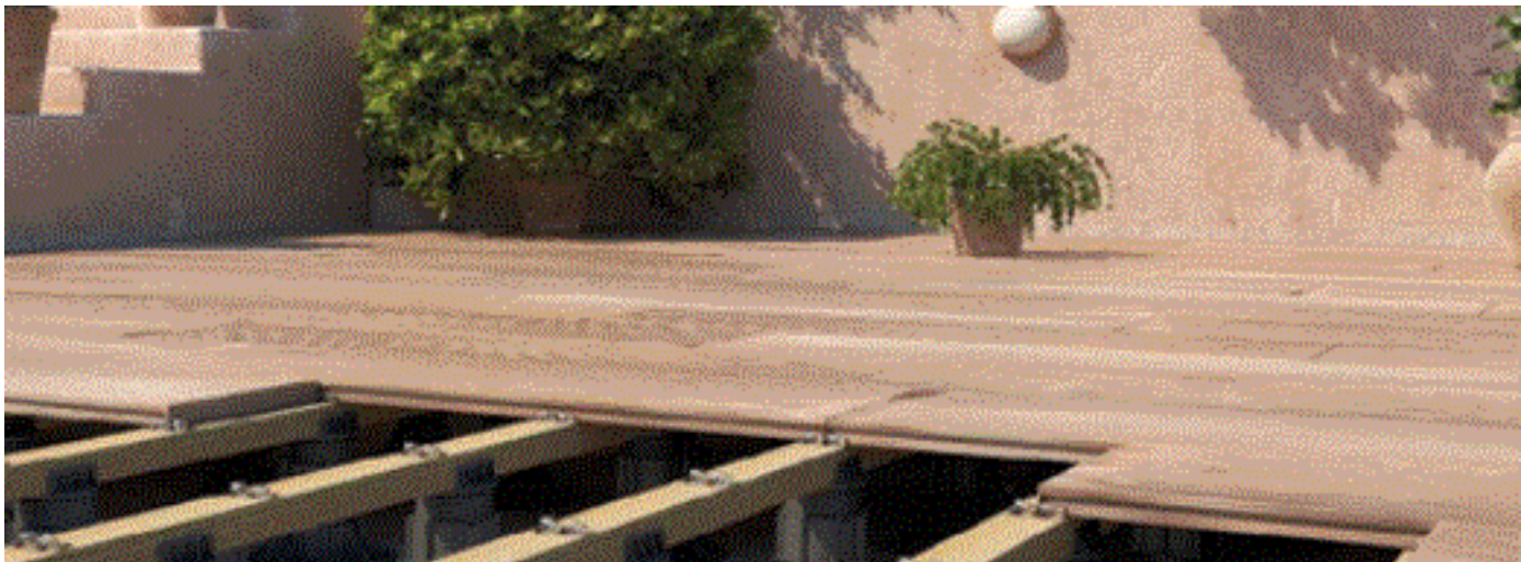
Sistema de impermeabilización, protegida con tarima flotante.